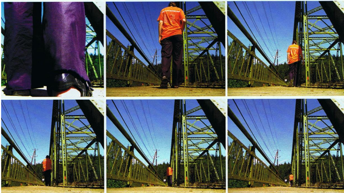
Mit geringerer Größe schwindet auch die Bedeutung eines Subjektes.

Wenn sich eine Figur von der Kamera in einem bestimmten Winkel entfernt, anstatt geradeaus zu gehen, findet eine Größenreduzierung statt, die jedoch nicht so schnell vonstatten geht, als liefe die Person geradeaus. Dasselbe trifft zu, wenn eine Person im Winkel von 45 Grad auf die Kamera zuläuft. Zeichnen Sie am Kopf und an den Füßen Punkte ein, die Sie während der Bewegung verfolgen. Dabei entstehen zwei konvergente Linien, die sich in einem Punkt am Horizont treffen.