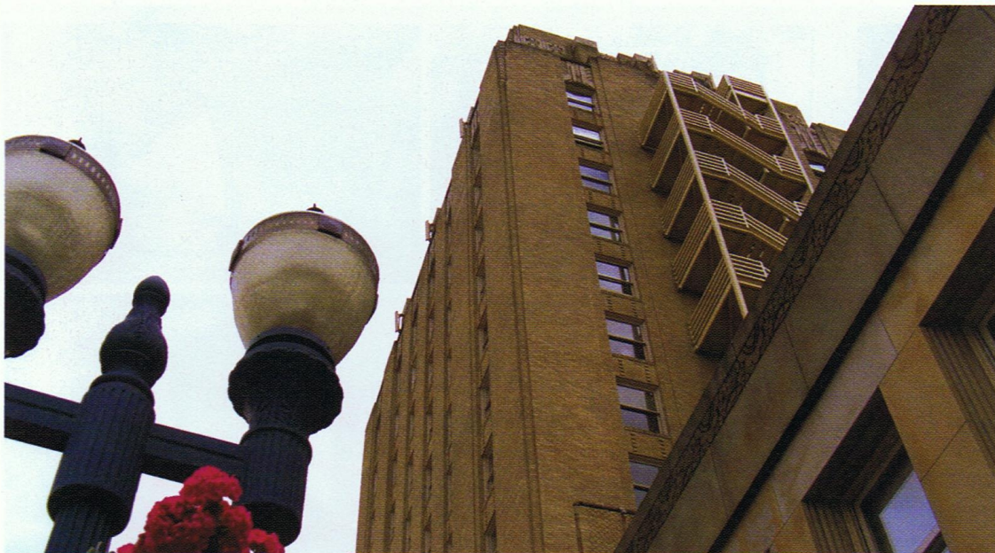
Wenn wir zu Gebäuden aufschauen, beschleicht uns das Gefühl, winzig und unbedeutend zu sein.

Bei einem Streit zwischen zwei Figuren wird ein dominanter Charakter eher durch eine niedrige Kameraposition gezeigt (der Zuschauer schaut auf), während der Schwächere der beiden von oben herab betrachtet wird. Der Held wird von unten gefilmt, auf den Bösewicht schaut die Kamera von oben. Dieses Konzept kann ebenso auf Objekte und Orte angewendet werden. Indem man zu hohen Gebäuden in einer Stadt aufschaut, impliziert das deren Dominanz über den Betrachter – so sehen wir alles aus der Ameisenperspektive.