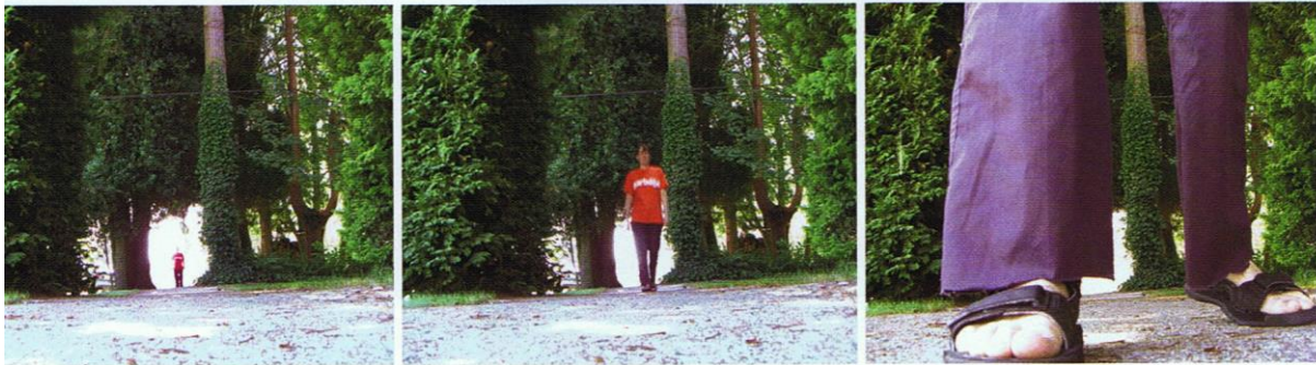
Je größer ein Subjekt im Bild ist, desto stärker ist es.

Es gibt zwei Grundprinzipien bei der Inszenierung von Figuren was Anzahl, Größe und Perspektive betrifft. Immer gilt: Je näher sich eine Figur an der Kamera befindet, desto größer ist sie. Je größer sie ist, desto stärker und dominanter wirkt sie. Wenn eine Figur auf die Kamera zuläuft oder sich die Kamera zur Figur hinbewegt, vergrößert sich die Figur und nimmt einen größeren Bildanteil ein (Abbildung oben). Entfernt sich die Figur von der Kamera oder die Kamera von der Figur, wird diese kleiner und scheinbar weniger wichtig für den Zuschauer (Abbildung unten).