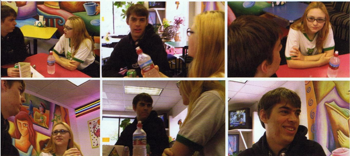
Einige der Kamerapositionen, um eine Einstellung mit zwei Charakteren abzubilden.

Wenn sich zwei Personen anschauen und unterhalten, gibt es einige wichtige Positionen, die die Kamera einnehmen kann: nah oder fern, hoch oder tief, links oder rechts.