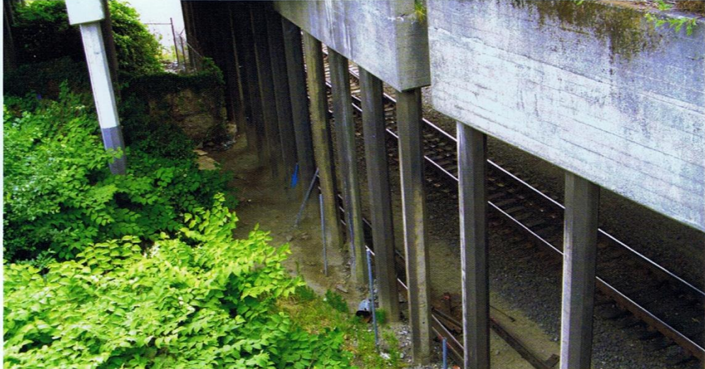
Je höher und übertriebener die Perspektive ist, desto größer wird das Gefühl von Dominanz.

Es gibt unzählige Möglichkeiten, die sich durch intelligente Kamerapositionen für den gewissenhaften Filmmacher eröffnen, der mit der Kamera ein Bild malen will.